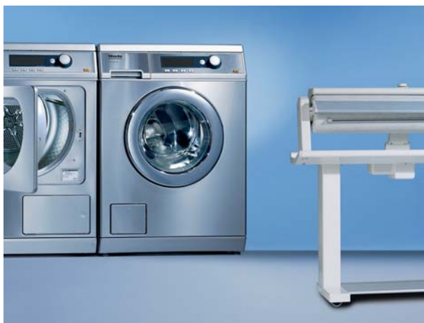
Lavadora PW 6065 plus, secadora PT 7136 plus, planchadora HM 16-83