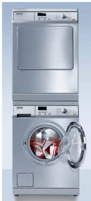
Lavadora PW 5065, secadora PT5136